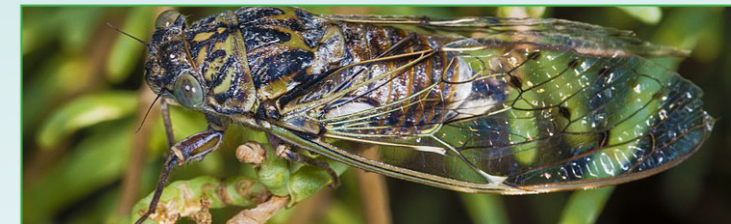
La Cigale de l'orne - Christian Ferrer

Le « chant » caractéristique des cigales est réservé aux mâles car il permet d'attirer les femelles. Le son est émis par un organe spécialisé appelé « cymbale » situé au niveau de l'abdomen. Ce chant est donc appelé « cymbalisation ».