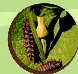
La Diane chenille