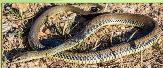
La Couleuvre de Montpellier - Diego Delso