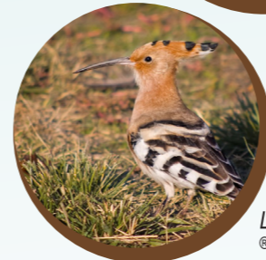
La Huppe fasciée