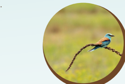
Le Rollier d'Europe