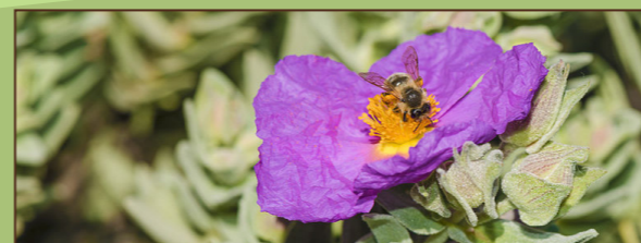
Ciste blanc Christian Ferrer

Le Mont-de-Vergues est une colline méditerranéenne caractérisée par une garrigue à Chêne kermès, Ciste blanc, Thym et Romarin qui se mêle à une pinède à Pin d'Alep et une chênaie verte. Ce milieu est le territoire privilégié de la cigale, symbole du sud de la France. Une vingtaine d'espèces de cigales coexistent dans notre région, la Cigale de l'orne étant la plus répandue.